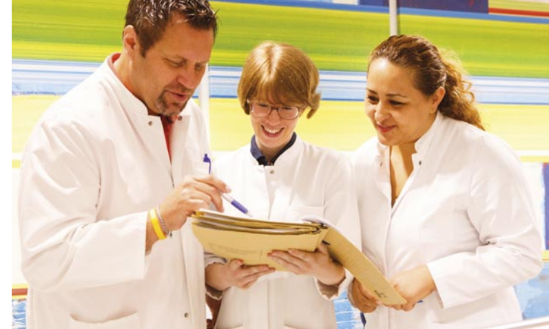
Medizin im Dialog