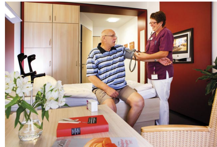
Einzelzimmer mit Komfort

Neu: Sie können auch eines unserer sechs Apartments buchen – als Wahlleistung. Infos zu dieser besonderen Unterbringung, den Serviceleistungen und den Kosten geben wir Ihnen gerne bereits im Vorfeld Ihres Aufenthaltes in der Rehaklinik am Berger See.