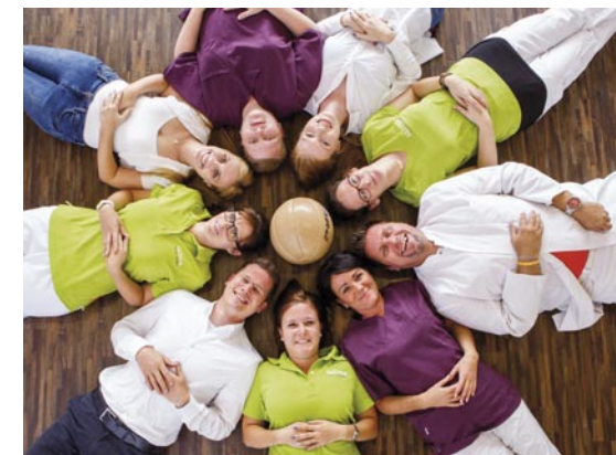
Ein starkes Team

Aber auch die vielen Servicekräfte sowie alle Ansprechpartner in Sozial- oder Verwaltungsfragen tragen jeden Tag dazu bei, dass unser Haus nicht nur zu den modernsten, sondern vor allen Dingen auch zu den freundlichsten Rehakliniken in Deutschland zählt. Die räumliche Vernetzung mit dem Akutkrankenhaus Bergmannsheil Buer optimiert unsere diagnostischen und therapeutischen Möglichkeiten. Denn wie gesagt: Zusammen sind wir ein starkes Team!